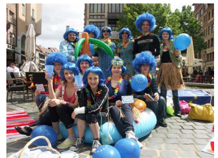
„Erst wählen, dann baden!“ Junges Team für Europa rief Urlauber/innen zur Briefwahl auf

In einigen europäischen Ländern konnten rechtspopulistische und europakritische Parteien Stimmenzuwächse verzeichnen. Die offen rechtsextremistische ungarische Jobbik-Partei erzielte etwa 14,8 %. Auch in Bulgarien und in Italien gingen die Rechten als Wahlsieger hervor. Deutliche Zuwächse für Rechtspopulisten gab es zudem in den Niederlanden (17 % für die PVV des Anti-Islam Politikers Geert Wilders) und in Österreich (13,1 Prozent für die FPÖ) sowie in Großbritannien, Finnland, Rumänien und Dänemark.