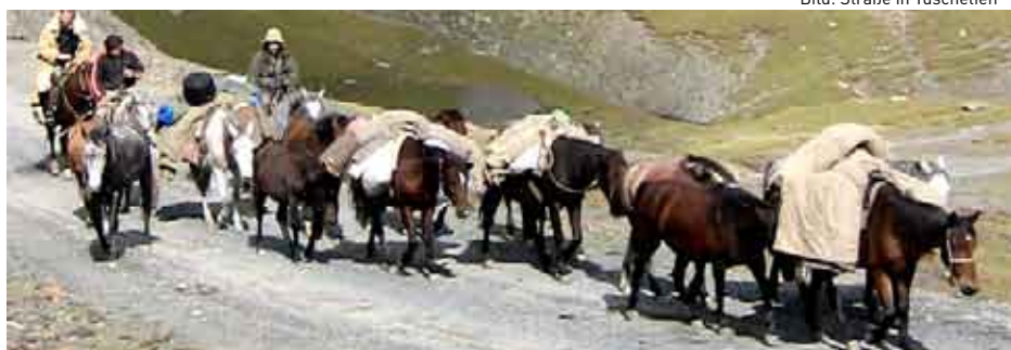
Bild: Straße in Tuschetien

Der Kaukasus ist eine Region, die aufgrund ihres Reichtums an natürlichen Ressourcen und ihrer besonderen geografischen Brückenlage eigentlich eine Drehscheibe zwischen Nord und Süd, Orient und Okzident sein könnte. Wir als europäische Nachbarstaaten sind dringend aufgefordert, die Kaukasus-Staaten beim Aufbau einer funktionierenden Zivilgesellschaft zu unterstützen. Unter dieser Maßgabe will die EU am 14. November im Rahmen der Europäischen Nachbarschaftspolitik einen Aktionsplan mit Georgien, Armenien und Aserbaidschan unterzeichnen.